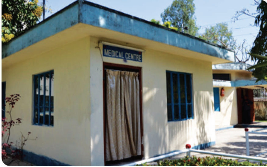
স্টোর এবং মেডিকেল সেন্টার

২০১৯-২০ অর্থবছরে পিপিআর অনুযায়ী একাডেমীর যাবতীয় মালামাল সংগ্রহ করা হয় এবং তা স্টক রেজিস্টারে এন্ট্রি পূর্বক পরিচালক-এর অনুমোদন সাপেক্ষে বিভিন্ন বিভাগ/শাখার চাহিদা অনুযায়ী সরবরাহ করা হয়। সরবরাহকৃত মালামালের মধ্যে স্টেশনারীজ, প্রশিক্ষণ স্টেশনারীজ, আসবাবপত্র, কম্পিউটার ও কম্পিউটার যন্ত্রাংশ অন্যতম।